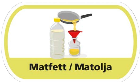
Matfett / Matolja